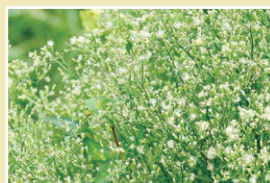
ヒメムカシヨモギ(65cm)