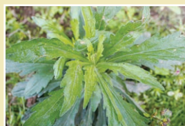
オオアレチノギク(25cm)