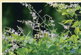
アレチナスビトハギ(32cm)