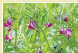
カラスノエンドウ(29cm)