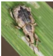
イネミスソウムシ