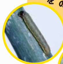
シロイチモジヨトウ