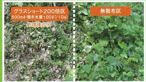
クスや、つる性の広葉雑草を枯らします。