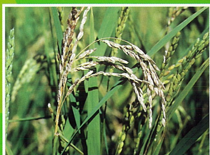
いもち病(穂いもち)