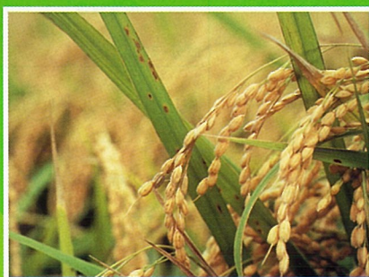
穂枯れ(ごま葉枯病菌)